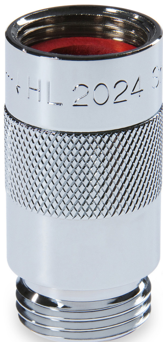
Linksboven: HL2024 Shower