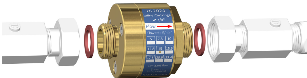
Afbeelding: voorbeeld montage HL2024 Inline Cartridge 3P 3/4"