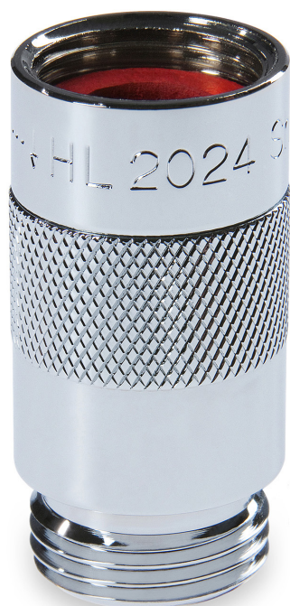
Arriba izquierda: HL2024 Shower