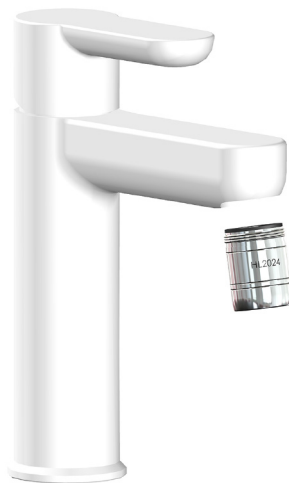
Imagen: HL2024 Tap M24 (dimensiones en mm)