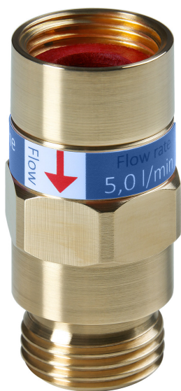
Arriba izquierda: HL2024 Inline 1P 1/2" f-m Abajo derecha: HL2024 Inline 1P 1/2" f-m - dimensiones (en mm)